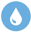
Feucht- und Nassraum